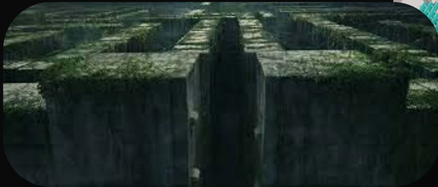
Render del labirinto

Project_Arcana utilizza un sistema di generazione del mondo di gioco completamente nuovo, consentendo al giocatore di vivere sempre un'esperienza nuova.